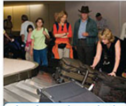
el reclamo de equipaje

Después del vuelo, la familia busca sus maletas en el reclamo de equipaje. Luego ellos pasan por la aduana donde los agentes miran las maletas y el pasaporte. Piden direcciones: «Por favor, ¿dónde queda la parada de autobús?»»