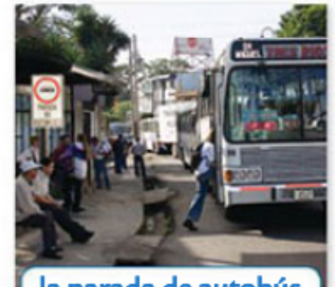
la parada de autobús