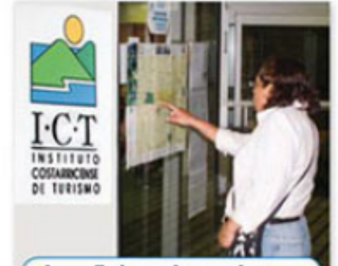
la oficina de turismo